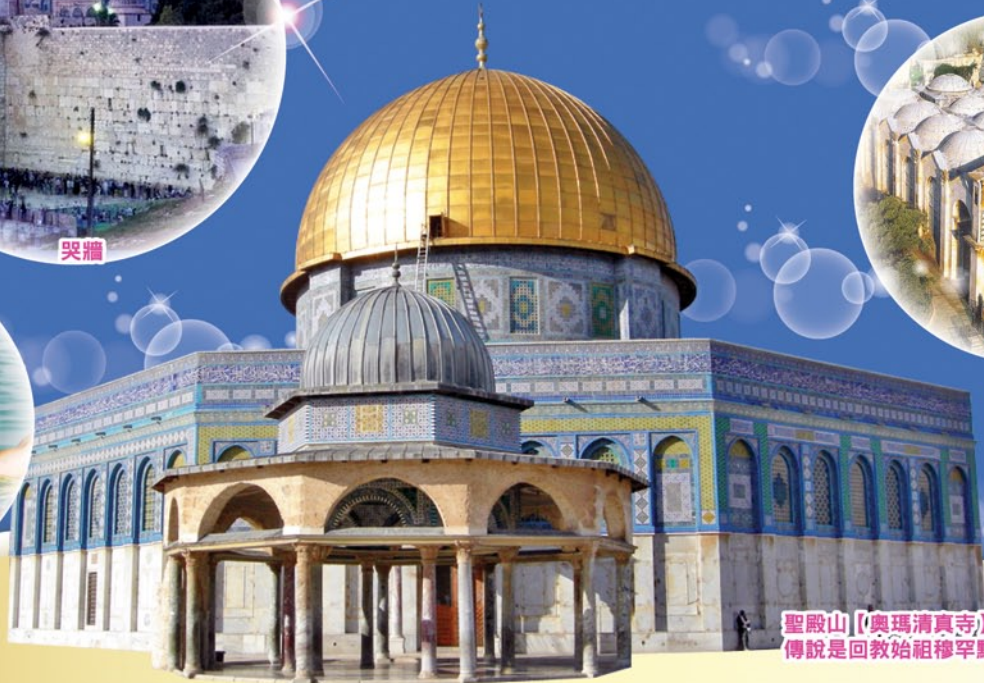
聖殿山【奧瑪清真寺】 傳說是回教始祖穆罕默德「踏石升天」之處