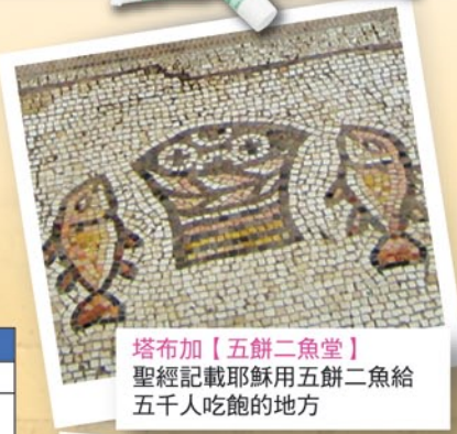
塔布加【五餅二魚堂】 聖經記載耶穌用五餅二魚給 五千人吃飽的地方