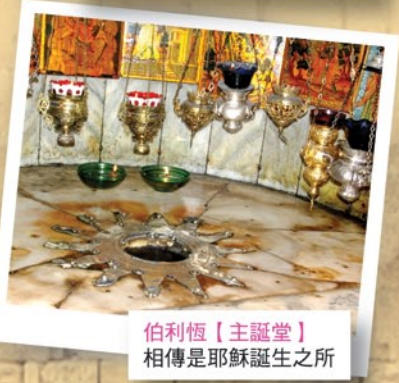
伯利恆【主誕堂】 相傳是耶穌誕生之所