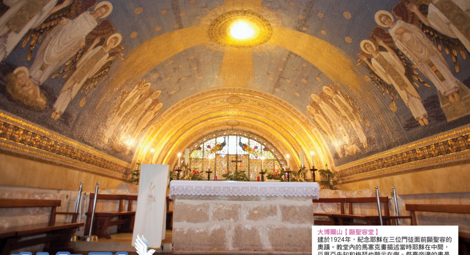
大博爾山【顯聖容堂】 建於1924年，紀念耶穌在三位門徒面前顯聖容的奧蹟。教堂內的馬塞克畫描述當時耶穌在中間，厄里亞先知和梅瑟也顯示在側。祭臺旁邊的畫是十二位天使。